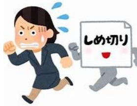
やばい！間に合わない