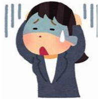
何から手をつければ、