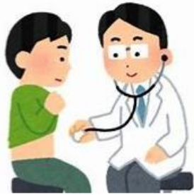
経営力向上計画と 省エネ診断で事前準備