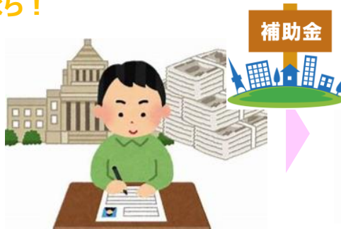
計画的な申請 ダブル加点で余裕