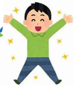
確実な採択！ 節税対策も！